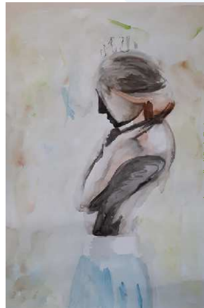
Acquerello di Paola Tosi

Giovedì 20 giugno 2019 dalle ore 8,30 alle ore 18,00 Sala Convegni "Elvo Tempia" Nuovo Ospedale di Biella Via dei Ponderanesi n. 2 - Ponderano